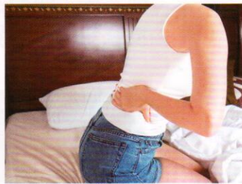
▲ 經痛是子宮內膜異位症的常見徵狀。

針對受孕方面，長在子宮內腔的肌瘤可以影響胚胎着床。即使成功着床，肌瘤也會增加中期懷孕流產的風險。另外，肌瘤在懷孕中會受荷爾蒙影響而長大，如果肌瘤長大的速度太快而供血不足，可以出現持續腹痛。子宮肌瘤亦可影響胎位和增加產後出血的情況。